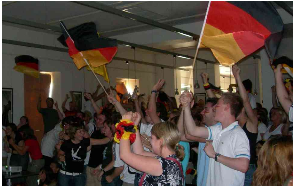
Jubel im Studentenhaus – Gewinnt Deutschland wirklich?