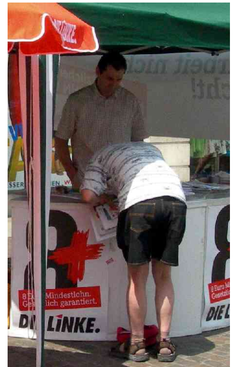
Unterschriften für Mindestlohn

Die Mitglieder und Vorstände wollen die Kooperation der beiden Würzburger Kreisverbände noch weiter verstärken.