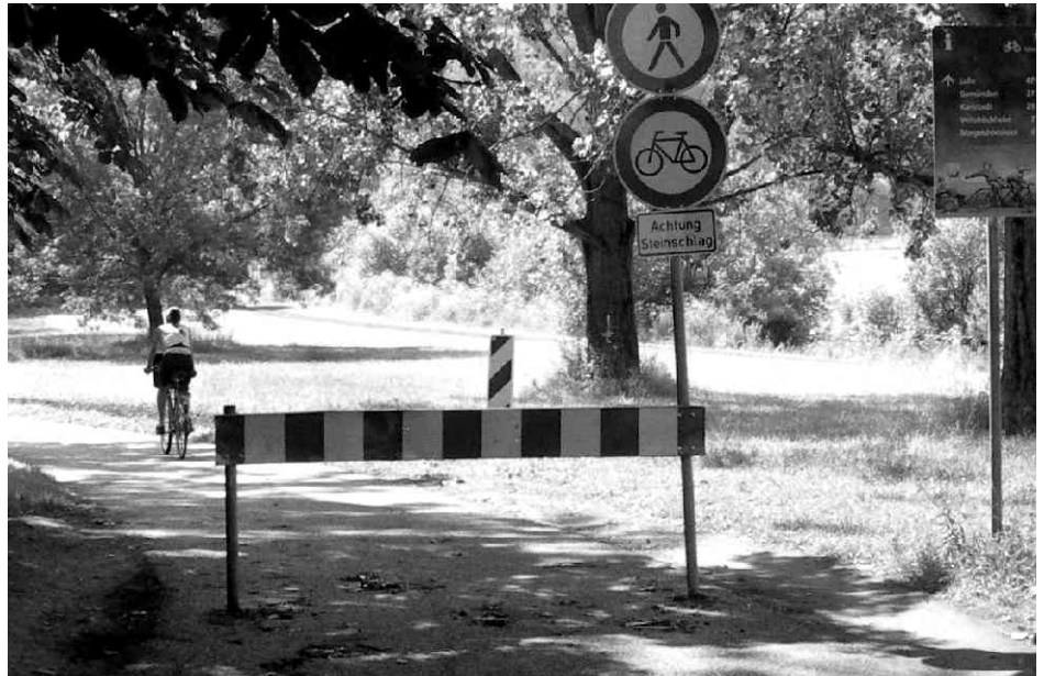
Radweg gesperrt... Barrikaden verstärkt

Als Konsequenz steht für die WVV ein Verlust von 3,5 Millionen Euro in der Bilanz. Das trifft auch die Stadt und damit die Bürger. Die jährlichen Zahlungen der WVV an die Stadt wurden um 3 Mio. Euro heruntergefahren. Das