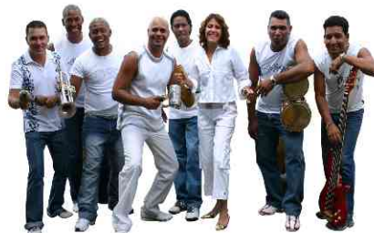
Bei schlechtem Wetter findet das Konzert im Saal statt.

durch Wassergewinnung mittels Solarenergie (Grundwasserförderung über photovoltaikbetriebene Tauchpumpen).