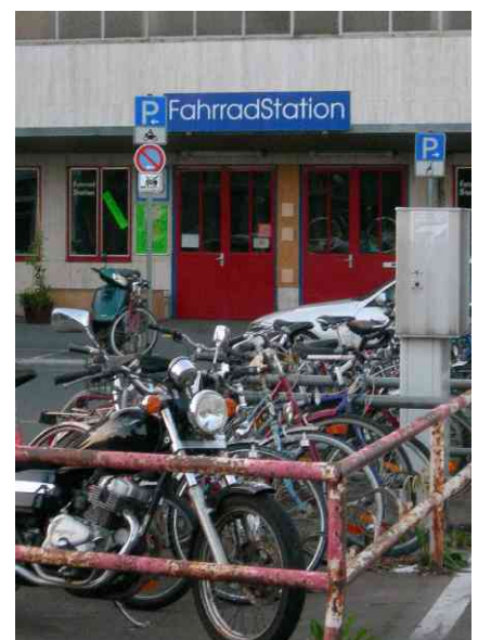
Fahrradstation am Bahnhof bald Geschichte