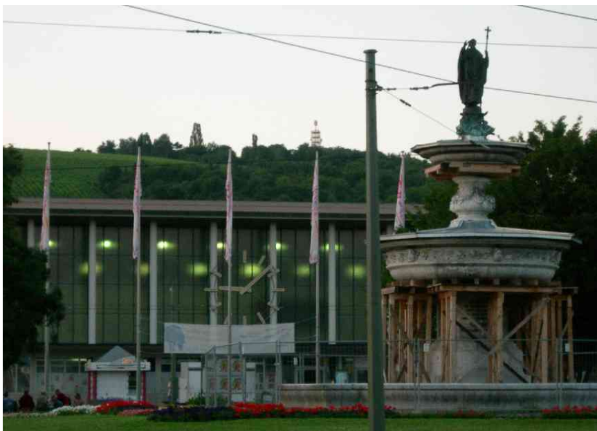
Bahnhof Würzburg mit dem Kiliansbrunnen